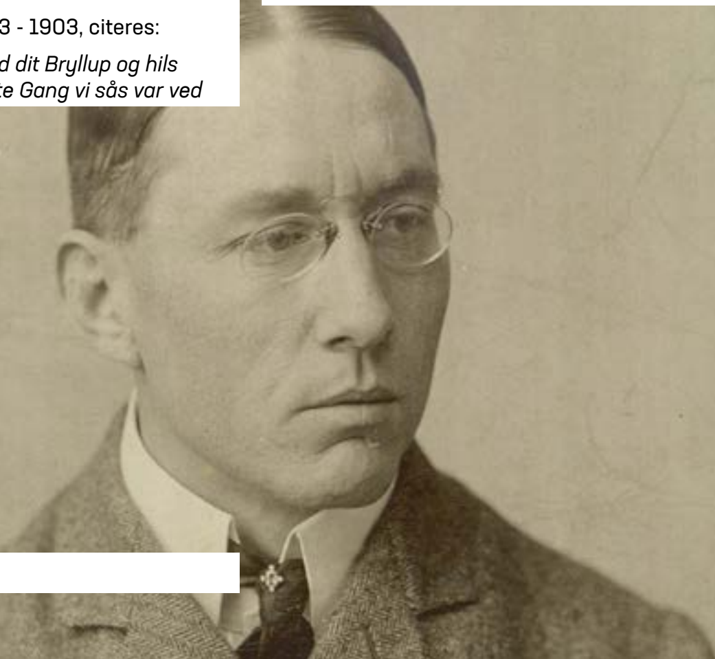
Johannes V. jensen i 1904.