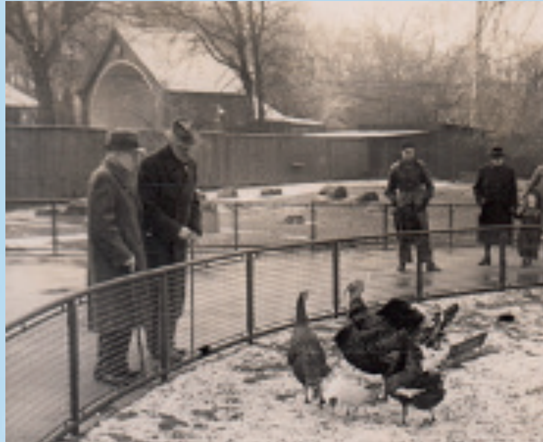
Johannes V. Jensen og Johannes Larsen i Zoologisk Have o. 1950