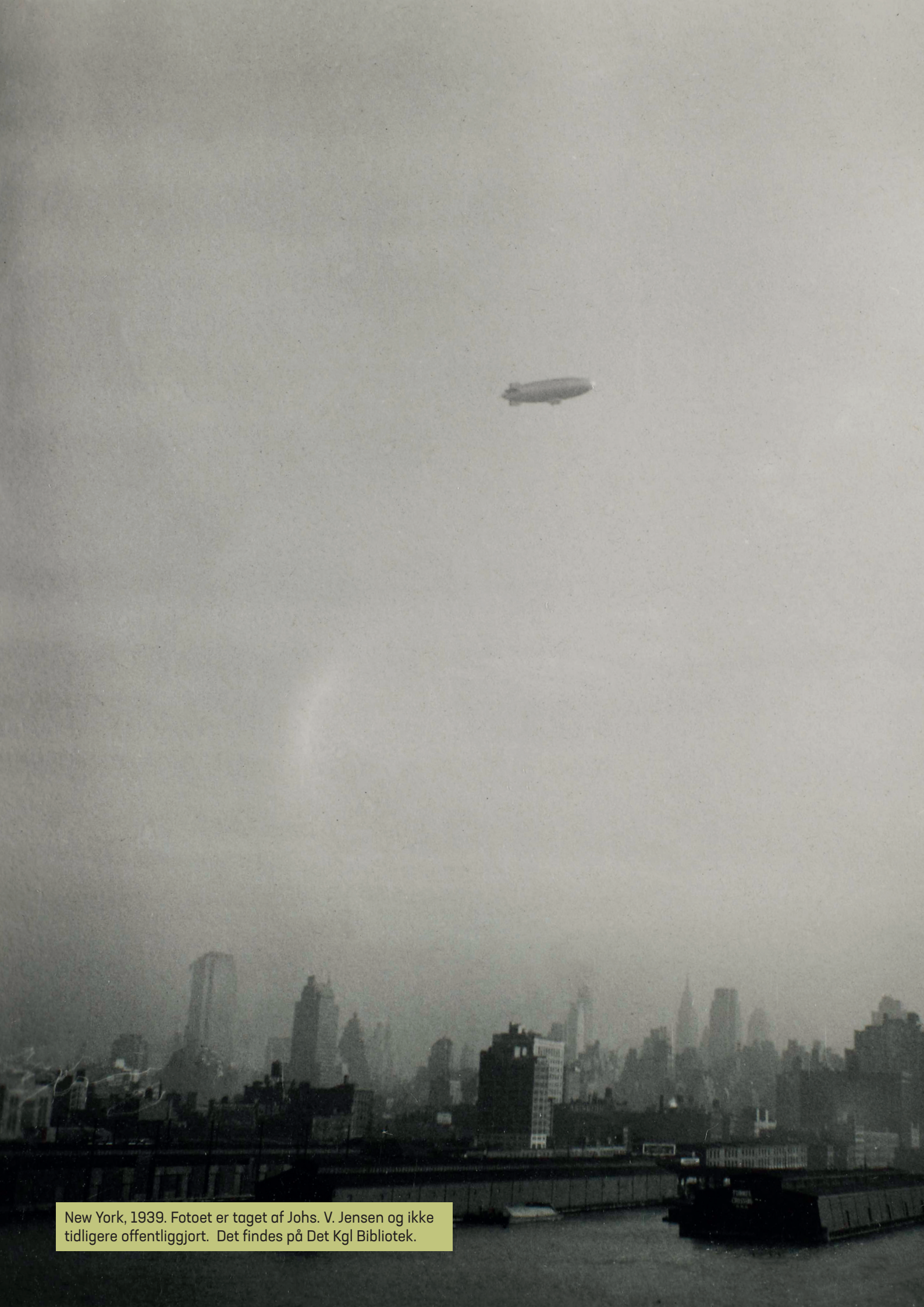
New York, 1939. Fotoet er taget af Johs. V. Jensen og ikke tidligere offentliggjort. Det findes på Det Kgl Bibliotek.